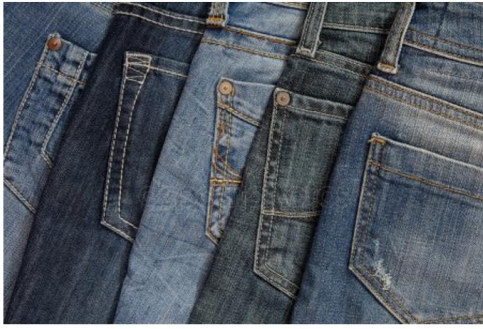
ДЖИНСЫ 2500 рублей