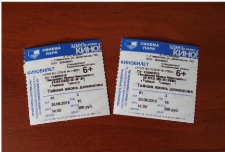
БИЛЕТЫ В КИНО 1200 рублей